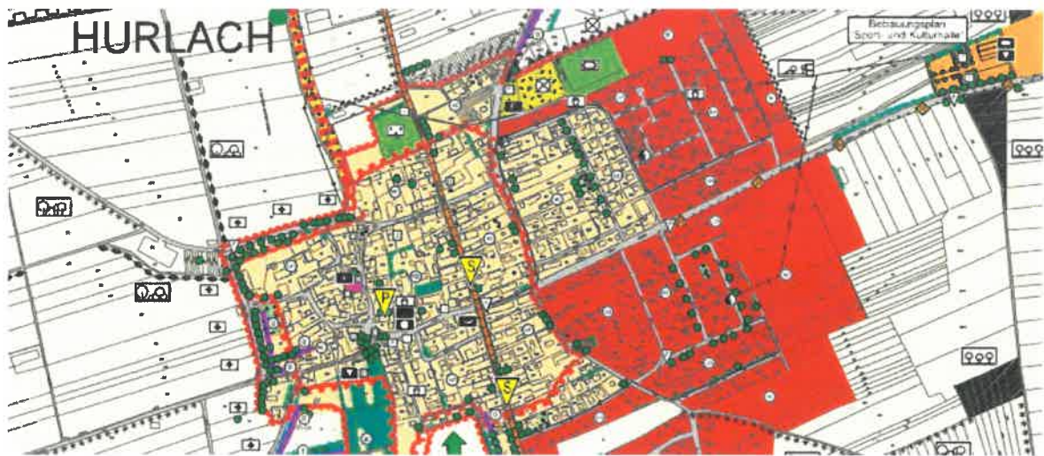
Abbildung 1: Aktuelle Darstellung im Flächennutzungsplan