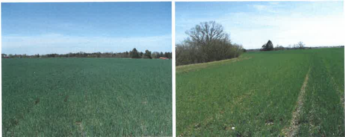
Abbildung 2: geplantes Projektgebiet

Das Vorhaben sieht die Aufstellung von Solarmodulreihen in einem Abstand von bis zu ca. 6 m mit einer Höhe von maximal ca. 3,5 m über dem Gelände auf einer Fläche von ca. 9,7 ha vor. Damit besteht für das Vorhaben eine Pflicht zu einer allgemeinen Vorprüfung des Einzelfalls nach dem § 3c UVPG Ziff. 18.7 der Anlage 1. Diese Vorprüfung wird durch den eigenständigen Umweltbericht, der sämtliche Umweltauswirkungen des Vorhabens (inklusive der Auswirkungen auf das Landschaftsbild) abhandelt, mit abgedeckt.